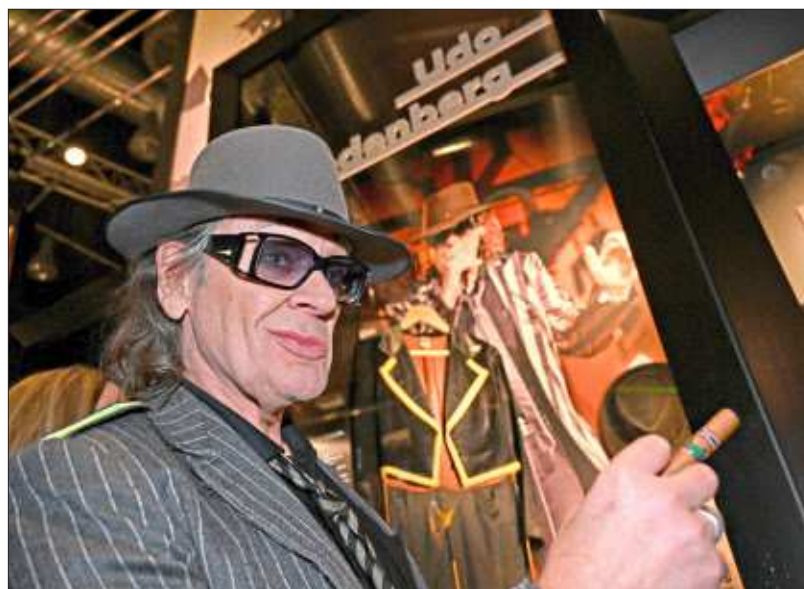
Der Sänger Udo Lindenberg steht am Tag vor der Neueröffnung des Museums in der Ausstellung vor einem Bild von sich.

net das Rock'n'Pop-Museum an diesem Wochenende neu. Zum Auftakt mit neuem Konzept gibt es nach der offiziellen Eröffnungsfest am Freitag am Samstag einen Tag der offenen Tür mit kostenlosem Eintritt – und natürlich Live-Konzerten.